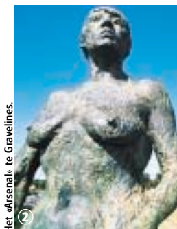
Het «Arsenal» te Gravelines.

Gezinsroute in de versterkingen van Gravelines, stad aan zee. Via deze route ontdekt u een militaire architectuur die het midden houdt tussen een Middeleeuwse vesting en een moderne citadel met geometrisch gevormde bastions. Maak van deze gelegenheid gebruik om ook een bezoek te brengen aan het Museum van originele tekeningen en prenten (Musée du Dessin et de l'Estampe originale).