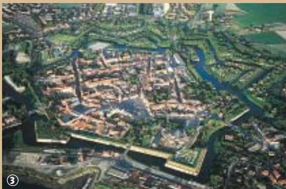
Zicht over de versterkte stad vanuit de lucht.

beschermden. De aanleg van een vaargeul die de stad met de zee verbond, werd tijdens de werken stopgezet. In 1658, valt Gravelines in handen van de Fransen en Vauban zorgt ervoor dat de aangevangen werken worden afgerond. Deze vesting kenmerkt zich door zijn hydraulisch systeem, dat toelaat om de diepte van de haven te reguleren, om