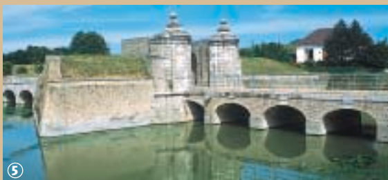
De «Porte aux Boulevards», Gravelines.

Vandaag behoren deze oorlogszuchtige tijden gelukkig tot het verleden. De versterkingen maken nu deel uit van het historisch erfgoed van de stad en de voormalige kruifabriek biedt vandaag onderdak aan het museum van originele prenten en tekeningen.